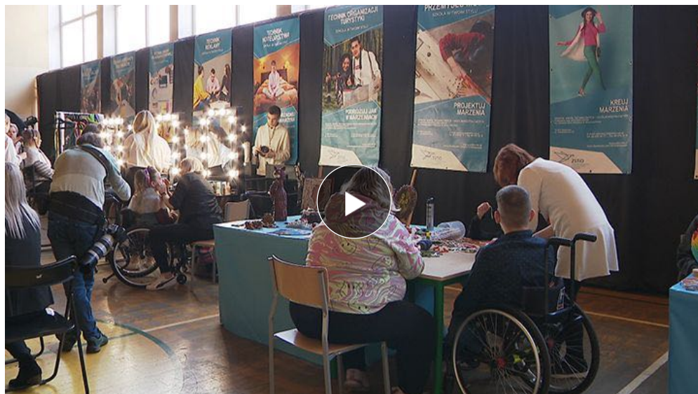
Przedstawiciele mongolskich uniwersytetów w ZSTiO z Oddziałami Integracyjnymi w Białymstoku

Reprezentacja trzech uniwersytetów z Mongolii, zajmująca się szkoleniem nauczycieli, przyjechała do Zespołu Szkół Technicznych i Ogólnokształcących z Oddziałami Integracyjnymi w Białymstoku, by podpatrywać dobre praktyki pracy z niepełnosprawną młodzieżą.